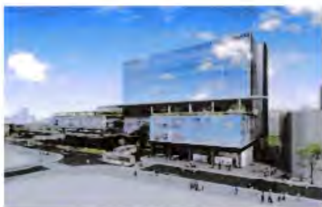
北口新駅ビル(北西より俯瞰)

駅南側については3階建の商業施設「ミュープラット」ができる予定 (令和5年度開業予定)