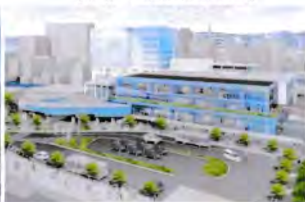
南口ビル(南東より俯瞰)